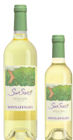
SurSur Sicilia Doc Grillo