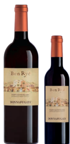
Ben Ryé Passito di Pantelleria Doc Zibibbo