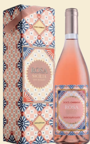
Rosa Sicilia Doc Rosato Nerello Mascalese, Nocera

La cura dei dettagli e la passione per la Sicilia uniscono Dolce&Gabbana e Donnafugata in una collaborazione in cui si incontrano creatività e artigianalità ; nasce così una collezione di vini straordinari ambasciatori dei colori, dei profumi e della cultura siciliana nel mondo: il seducente rosato Rosa , l'avvolgente bianco Isolano , l'elegante rosso Cuordilava e il prestigioso Tancredi .