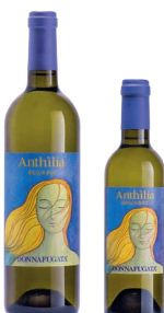
Anthilia Sicilia Doc Lucido in blend con altri vitigni