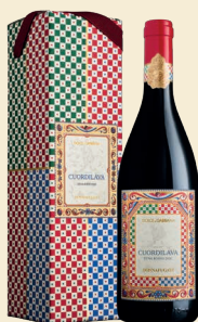
Cuordilava Etna Rosso Doc Nerello Mascalese