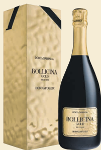
Bollicina Gold Brut Rosé Sicilia Doc Metodo Classico Nerello Mascalese

Bollicina Gold Brut Rosé , spumante metodo classico, rappresenta il coronamento della collaborazione e incarna la sintesi perfetta tra creatività stilistica e artigianalità produttiva .