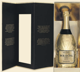
Kit Bollicina Gold Brut Rosé con copribottiglia Sicilia Doc Metodo Classico Nerello Mascalese