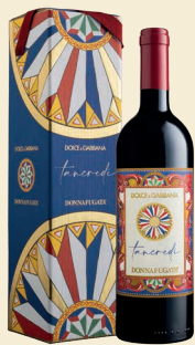
Tancredi Terre Siciliane Igt Cabernet Sauvignon, Nero d'Avola, Tannat