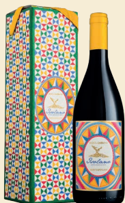
Isolano Etna Bianco Doc Carricante