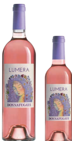
Lumera Sicilia Doc Nero d'Avola, Syrah, Nocera