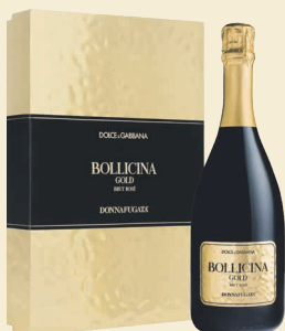
Bollicina Gold Brut Rosé con scatola Sicilia Doc Metodo Classico Nerello Mascalese