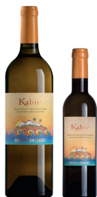
Kabir Moscato di Pantelleria Doc Zibibbo