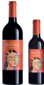
Sedara Sicilia Doc Nero d'Avola in blend con altri vitigni