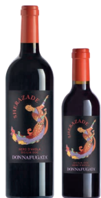
Sherazade Sicilia Doc Nero d'Avola