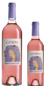
Lumera Sicilia Doc Nero d'Avola, Syrah, Nocera