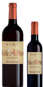
Ben Ryé Passito di Pantelleria Doc Zibibbo