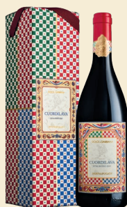
Cuordilava Etna Rosso Doc Nerello Mascalese