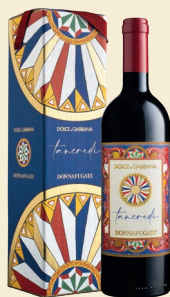
Tancredi Terre Siciliane Igt Cabernet Sauvignon, Nero d'Avola, Tannat