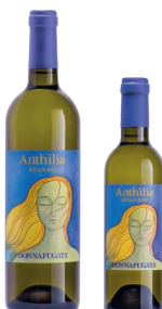
Anthilia Sicilia Doc Lucido in blend con altri vitigni