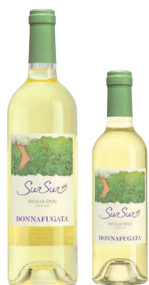
SurSur Sicilia Doc Grillo