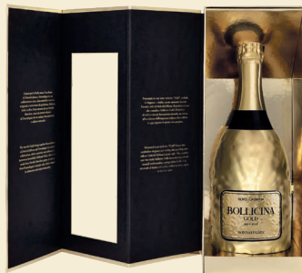
Kit Bollicina Gold Brut Rosé con copribottiglia Sicilia Doc Metodo Classico Nerello Mascalese