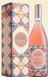
Rosa Sicilia Doc Rosato Nerello Mascalese, Nocera

La cura dei dettagli e la passione per la Sicilia uniscono Dolce&Gabbana e Donnafugata in una collaborazione in cui si incontrano creatività e artigianalità ; nasce così una collezione di vini straordinari ambasciatori dei colori, dei profumi e della cultura siciliana nel mondo: il seducente rosato Rosa , l'avvolgente bianco Isolano , l'elegante rosso Cuordilava e il prestigioso Tancredi .