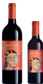
Sedàra Sicilia Doc Nero d'Avola in blend con altri vitigni