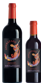
Sherazade Sicilia Doc Nero d'Avola