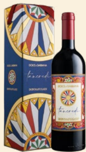
Tancredi Terre Siciliane Igt Cabernet Sauvignon, Nero d'Avola, Tannat