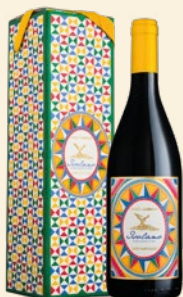
Isolano Etna Bianco Doc Carricante