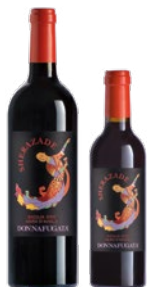
Sherazade Sicilia Doc Nero d'Avola