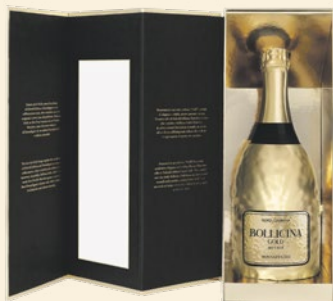
Kit Bollicina Gold Brut Rosé con copribottiglia Sicilia Doc Metodo Classico Nerello Mascalese