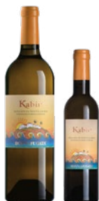
Kabir Moscato di Pantelleria Doc Zibibbo