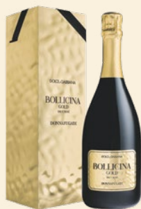
Bollicina Gold Brut Rosé Sicilia Doc Metodo Classico Nerello Mascalese

Bollicina Gold Brut Rosé , spumante metodo classico, rappresenta il coronamento della collaborazione e incarna la sintesi perfetta tra creatività stilistica e artigianalità produttiva .