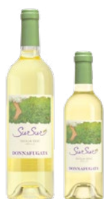
SurSur Sicilia Doc Grillo