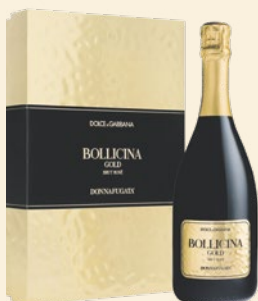
Bollicina Gold Brut Rosé con scatola Sicilia Doc Metodo Classico Nerello Mascalese