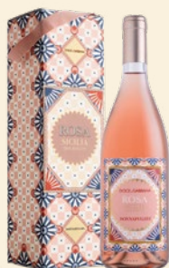
Rosa Sicilia Doc Rosato Nerello Mascalese, Nocera

La cura dei dettagli e la passione per la Sicilia uniscono Dolce&Gabbana e Donnafugata in una collaborazione in cui si incontrano creatività e artigianalità ; nasce così una collezione di vini straordinari ambasciatori dei colori, dei profumi e della cultura siciliana nel mondo: il seducente rosato Rosa , l'avvolgente bianco Isolano , l'elegante rosso Cuordilava e il prestigioso Tancredi .