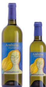
Anthilia Sicilia Doc Lucido in blend con altri vitigni