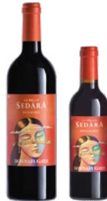
Sedàra Sicilia Doc Nero d'Avola in blend con altri vitigni