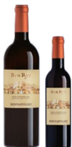
Ben Ryé Passito di Pantelleria Doc Zibibbo