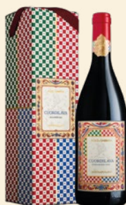
Cuordilava Etna Rosso Doc Nerello Mascalese