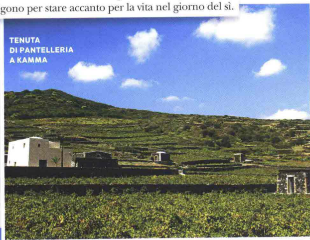
TENUTA DI PANTELLERIA A KAMMA