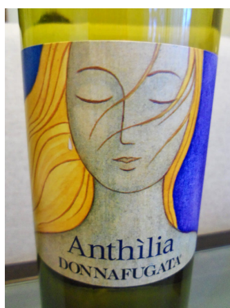
Anthilia di Donnafugata

La viticoltura siciliana ha fatto passi da gigante negli ultimi decenni; sono infatti lontani i tempi in cui le aziende del nord Italia acquistavano uva dai produttori del sud per tagliare i loro vini poveri di zuccheri, mentre sono passati (o stanno passando) i tempi in cui i viticoltori siciliani facevano vini concentrati, pesanti, vanigliati per seguire le mode d'oltreoceano.