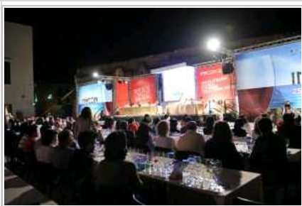
Menfi, Italia. Una degustazione nel corso di una precedente edizione del festival vitivinicolo Inycon.

Un'occasione per scoprire grandi vini. E le bellissime terre dove nascono. Dai luoghi del Gattopardo al comprensorio delle Terre Sicane.