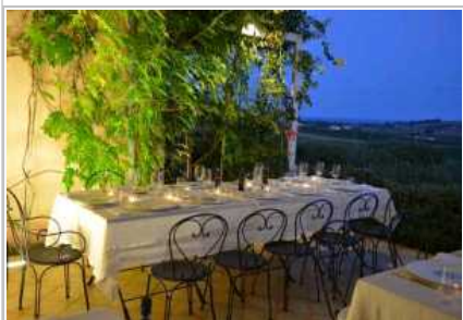
Menfi, Italia. Un esterno della Foresteria Planeta.

MANGIARE E DORMIRE. Una scelta in linea con la vocazione vitivinicola del territorio di Menfi è la Foresteria Planeta. Appartenente alla omonima famiglia antesignana del successo del vino siciliano, questo lussuoso resort ubicato a 5 chilometri dalle spiagge di Porto Palo, è strutturato come un piccolo borgo di case rurali sulla al centro di vigne e uliveti a perdita d'occhio. È dotato di 14 camere di diverse dimensioni, tutte con vista panoramica. Il prezzo giornaliero di un soggiorno in camera doppia con colazione varia da 180 a 260 euro. Altra soluzione di charme, il relais Casa Mirabile, 11 camere all'interno di un antico 'baglio'. I prezzi variano a