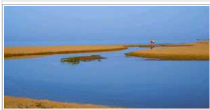
Menfi, Italia. Un'immagine della Riserva della foce del fiume Belice.

MUSICA E INTRATTENIMENTO. Degustazioni e cultura saranno il leit motiv dell'evento. Tra Palazzo Planeta, piazza Vittorio Emanuele III e via della Vittoria il pubblico viene coinvolto in un viaggio sensoriale per mezzo di vini bianchi, rossi e da meditazione delle Terre Sicane. Vini che vengono raccontati dal duo Fede&Tinto, conduttori di Decanter, programma di Rai Radio 2 dedicato all'eno-gastronomia con il contributo di alcuni noti giornalisti italiani e stranieri delle più importanti testate di settore. Nel corso della tre giorni, i talk food daranno