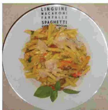
Penne aux poivrons et mascarpone

Le vignoble de la Sicile avec ces 100,000 hectares de vignes est le plus grand de l'Italie. La maison Donnafugata est compte parmi les plus grands producteurs de la Sicile. Elle cultive la vigne à deux endroits, soit le vignoble de Contessa Entellina situé au sud-ouest de l'île et à une heure de Palerme, ainsi qu'un autre sur l'île de Pantellaria d'origine volcanique situé plus au sud de la Sicile.