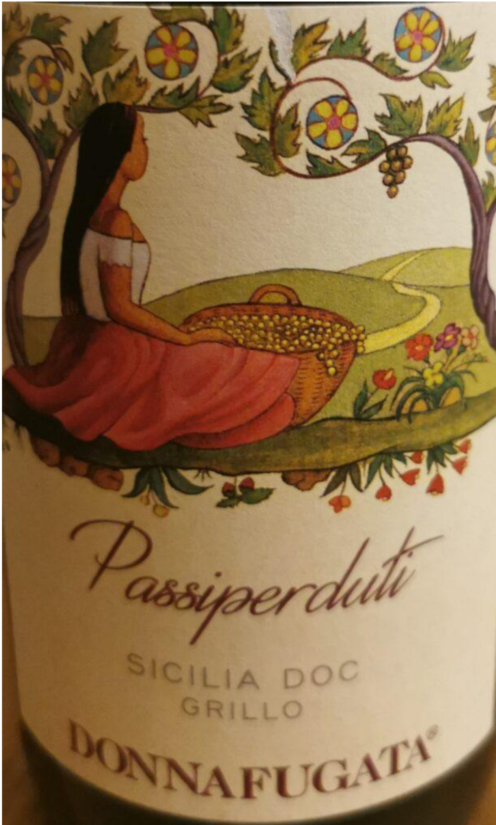
Sicilia Doc Grillo "Passiperduti" 2021 . Alcol 13,5%. Da uve Grillo 100% prodotte nella Tenuta di Contessa Entellina. Affinato per 3 mesi in vasca e 3 mesi in bottiglia. Colore giallo paglierino scarico. All'olfatto emergono note di salvia e ortica, di fiori gialli (ginestra), frutta matura e candita, sbuffi minerali (pietra focaia). Al gusto è sapido, salino, con spiccate note agrumate e di erbe aromatiche. Di buona persistenza.