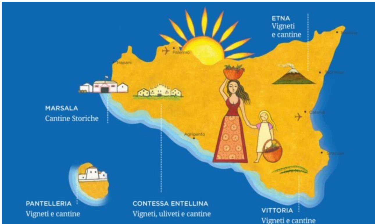
Mappa dei vigneti e cantine dell'azienda