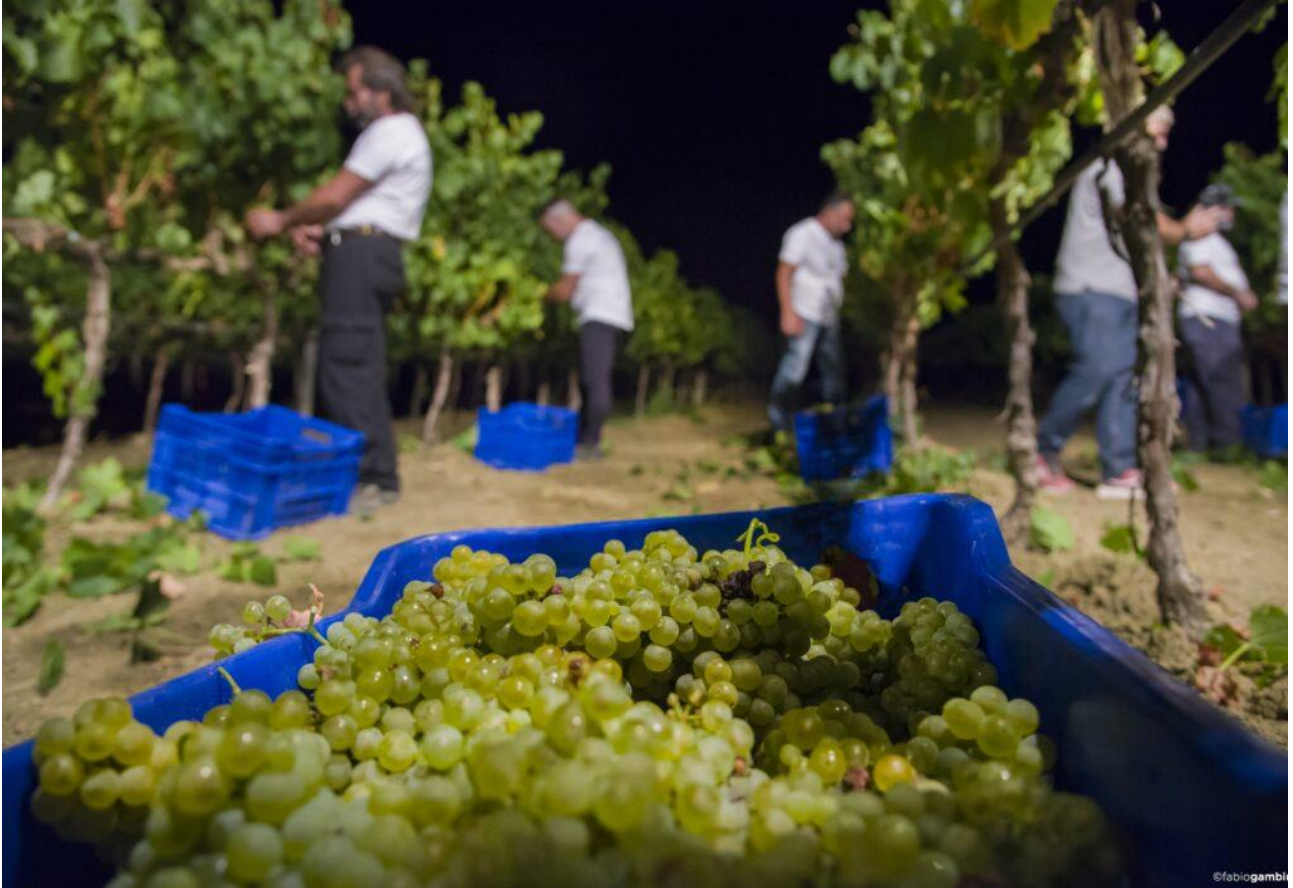
Vendemmia notturna nella tenuta Contessa Entellina

Rallo era nel mondo del vino già dal 1851: le sue storiche cantine si trovano a Marsala) ed è stato uno dei maggiori innovatori dei vini siciliani. Ha iniziato a produrre vini secchi, bianchi e rossi, impiantando e valorizzando in abbinamento alle uve autoctone vitigni internazionali come Viognier, Chardonnay Syrah, Cabernet Sauvignon, Petit Verdot, in una zona – Contessa Entellina nella Valle del Belice, a 80 km da Palermo, situata in collina a circa 600 metri di quota – dove tradizionalmente si producevano vini bianchi da Catarratto e Inzolia.