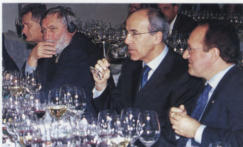
Franz Fischler con Tibor Tszany segretario di Stato (ministro dell'Agricoltura) dell'Ungheria

maggiori tracce sui mercati e nel cuore dei consumatori di tutto il mondo.