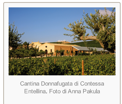
Cantina Donnafugata di Contessa Entellina.

Donnafugata nasce in Sicilia nel 1983 dall'iniziativa di una famiglia che conta oltre 160 anni di esperienza nel vino di qualità. L'avventura di Donnafugata inizia nelle storiche cantine della famiglia Rallo a Marsala e nelle vigne di Contessa Entellina , nel cuore della Sicilia occidentale; per giungere nel 1989 sull'isola di Pantelleria dove si producono vini naturali dolci. Con la vendemmia 2016, Donnafugata si espande nella Sicilia orientale, includendo nella sua produzione i vini delle prestigiose denominazioni Etna , Cerasuolo e Frappato di Vittoria .