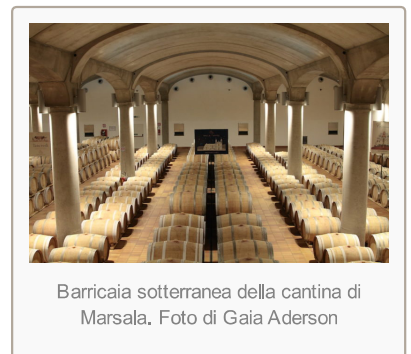
Barricaia sotterranea della cantina di Marsala.

La cantina di Contessa Entellina , nel cuore della Sicilia occidentale, circondata da vigneti (270 ettari) sia autoctoni sia internazionali produce vini complessi e ricchi di personalità. La cantina di Khamma a Pantelleria caratterizzata dai suoi vigneti di Zibibbo (68 ettari) coltivati ad alberello pantesco, Patrimonio dell'Unesco , che si armonizzano perfettamente nel particolare contesto agricolo dell'isola del vento, grazie a bellissimi terrazzamenti e muretti a secco . A Randazzo , località situata sul versante nord dell' Etna , l'azienda conta 15 ettari di vigneti e una cantina di vinificazione. Nella Sicilia orientale, ad Acate si trovano altri 18 ettari di vigneti coltivati.