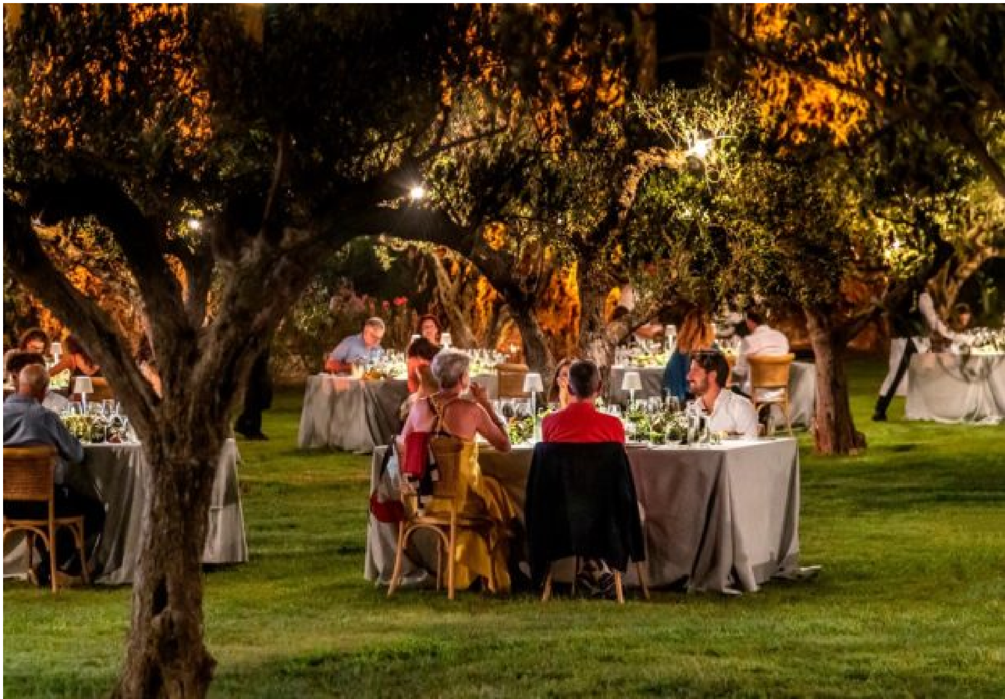
Calici di Stelle 2020 nella tenuta di Donnafugata a Contessa Entellina