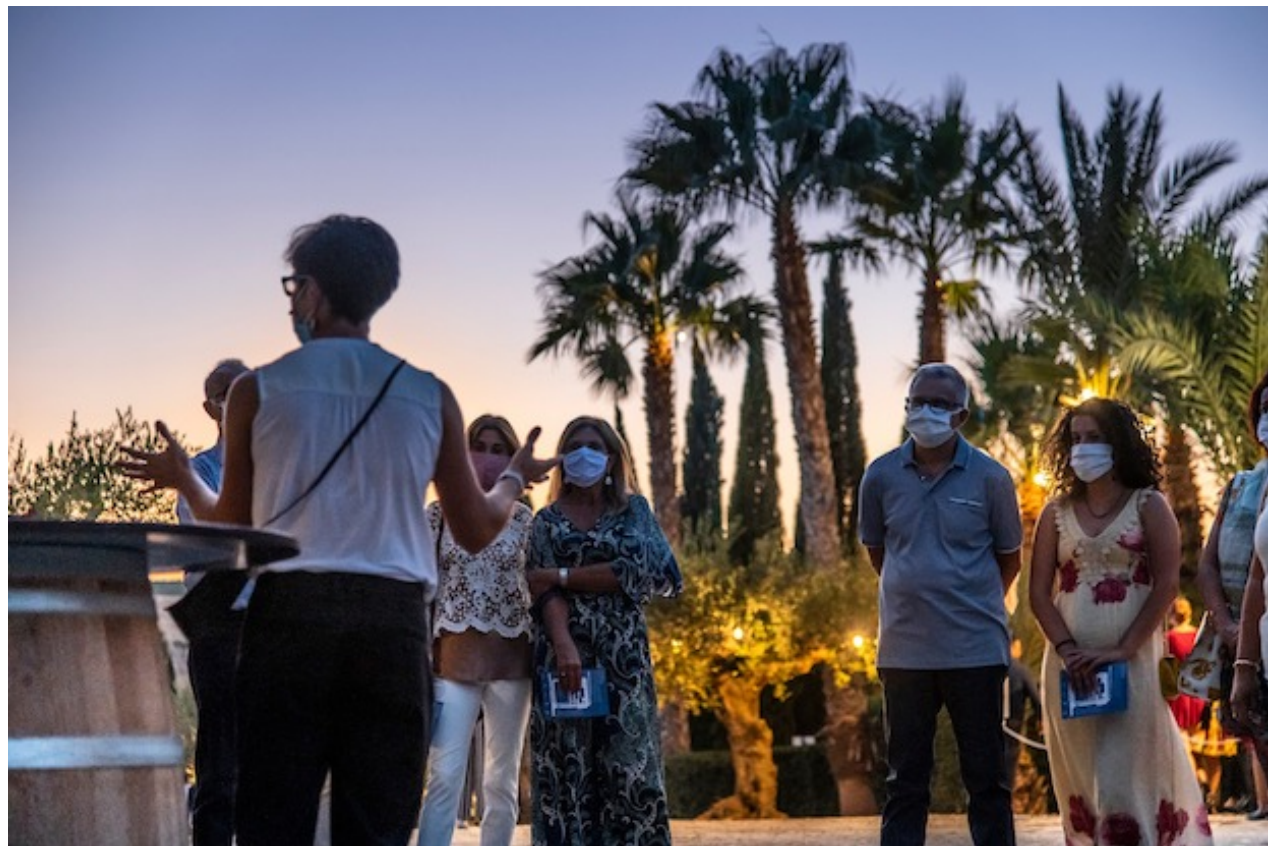
Visita nei vigneti di Donnafugata durante Calici di Stelle 2020

Tra gli eventi più attesi in quest'occasione che unisce il vino e alle stelle, c'è la serata che si svolge nella tenuta di Donnafugata a Contessa Entellina, grande realtà vitivinicola italiana che ha mostrato il carattere dei vini siciliani in tutto il mondo e che ogni anno inaugura la nuova vendemmia nella notte di San Lorenzo festeggiando insieme ai clienti più affezionati.