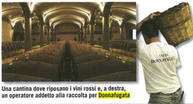
Una cantina dove riposano i vini rossi e, a destra, un operatore addetto alla raccolta per Donnafugata

Ma forse più della vite è l'olivo il simbolo per eccellenza dell'agricoltura mediterranea. Anche sul fronte dell'olio l'elenco dei produttori di qualità sarebbe molto lungo. Ci si può li-