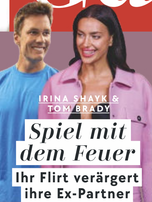
IRINA SHAYK & TOM BRADY