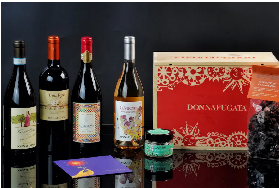
Weine von Donnafugata zu Weihnachten – hier unsere ausgesuchten Positionen